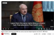
Search why Poland asked to withdraw its migrants... just like Muslim ones.